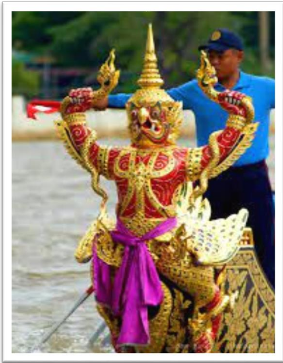
เรือครุฑเหินเห็จ