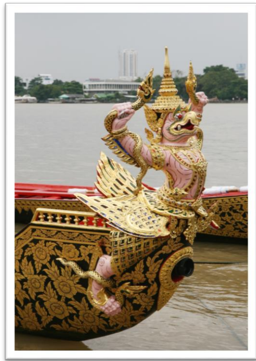
เรือครุฑเตร็จไตรจักร

โขนเรือทั้งสองลำเป็นไม้จำหลักรูปครุฑจับนาค ๒ ตัวชูขึ้น ลงรักปิดทองประดับกระจก เรือครุฑเหินเห็จ ครุฑกายสีแดง ส่วน เรือครุฑเตร็จไตรจักร ครุฑกายสีชมพู