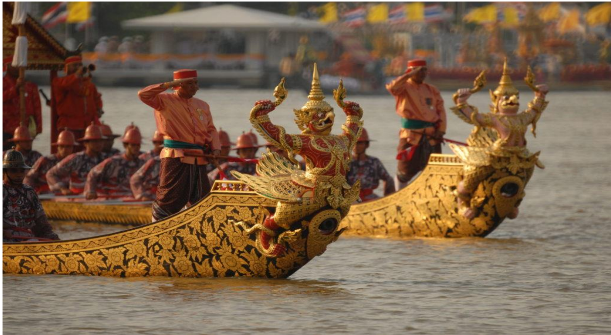
เรือครุฑเหินเห็จ (ซ้าย) เรือครุฑตรีจไตรจักร (ขวา)

ชื่อเรือ 2 ลำนี้สะท้อนถึงอิทธิพลคัมภีร์ปุราณะของอินเดียที่มีต่อคตินิยมและศิลปกรรม ไทย ตามคัมภีร์ปุราณะ ครุฑเป็นเจ้าแห่งนกทั้งหลาย หรือเทพปักษิน ซึ่งผูกพันกับพระวิษณุ เพราะพระวิษณุทรงท่องไปในสวรรค์โดยมีครุฑเป็นพาหนะ